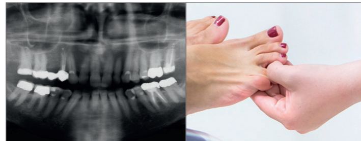
Orthopantomogramm (OPG): Panorama-Röntgenbildaufnahme des gesamten Kiefers

Als Grundlage dafür dient eine aktuelle Panorama-Röntgenbildaufnahme des gesamten Kiefers, ein sog. Orthopantomogramm (OPG).